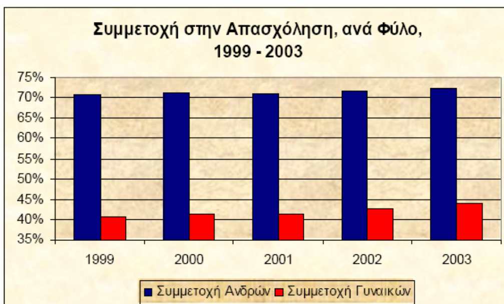
Πίνακας 3: ΕΣΔΑ 2003

Ωστόσο, το ποσοστό απασχόλησης και ειδικότερα των γυναικών παραμένει χαμηλό (τόσο σε σύγκριση με τον μέσο όρο στην Ε.Ε., όσο και σε σύγκριση με τους στόχους της στρατηγικής της Λισσαβόνας). Υψηλό εξακολουθεί να είναι το ποσοστό ανεργίας, κυρίως για γυναίκες και νεο-εισερχόμενους στην αγορά εργασίας, καθώς παραμένουν περιορισμένες οι ευκαιρίες εργασίας με μερική απασχόληση. Ενώ είναι ευπρόσδεκτη η τάση της οικονομίας να δημιουργεί νέες θέσεις εργασίας πλήρους απασχόλησης, η έλλειψη ευκαιριών εργασίας με καθεστώς μερικής απασχόλησης ενδέχεται να αποθαρρύνει ιδιαίτερες κατηγορίες του πληθυσμού από το να αναζητήσουν θέση αμειβόμενης εργασίας. Πιθανή αντιστροφή της τάσης αυτής, μπορεί, να σημειωθεί μετά τις δεσμεύσεις για 25.000 νέες θέσεις εργασίας μερικής απασχόλησης για την παροχή υπηρεσιών κοινωνικού χαρακτήρα. Στην ίδια κατεύθυνση μπορεί να συμβάλει και η εφαρμογή των νέων μέτρων που προωθούνται με αντίστοιχες νομοθετικές ρυθμίσεις για την αύξηση της απασχόλησης.