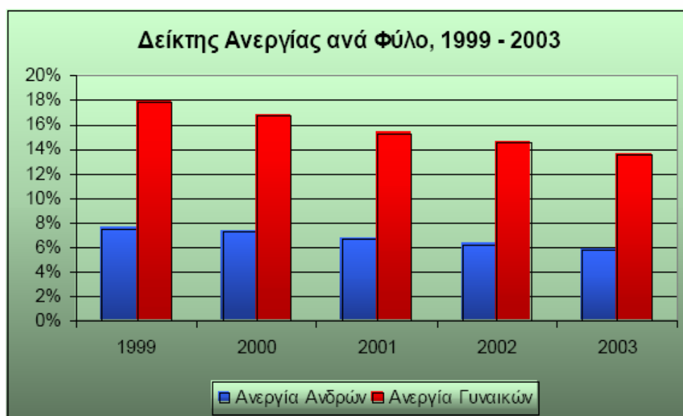
Πίνακας 4: Εθνικό Σχέδιο Δράσης για την Απασχόληση (2003)

Τέλος, οι συγκριτικές επιδόσεις ανδρών και γυναικών ως προς την ανεργία επιβεβαιώνουν την εικόνα των προηγούμενων ετών. Αν και η ανεργία των γυναικών μειώνεται, η ψαλίδα εν τούτοις παραμένει πολύ μεγάλη.